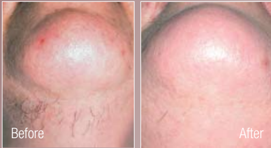
Nach 6 Anwendungen