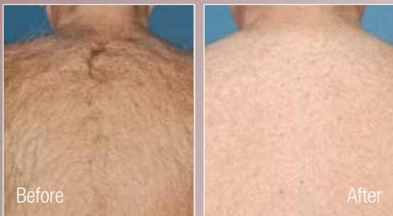
nach 10 Anwendungen