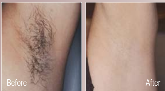
Nach 8 Anwendungen

Behandlungsergebnisse sind abhängig von der individuellen Haut- und Haarsituation des Patienten. Vorgestellte Ergebnisse können von persönlichen Ergebnissen abweichen (positiv wie negativ).